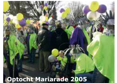
Optocht Mariarade 2005

Een van de hoogtepunten zal ongetwijfeld de Mariarader optocht zijn die in samenwerking met SBWM wordt georganiseerd en op carnavalsdinsdag door de straten van Mariarade zal trekken.